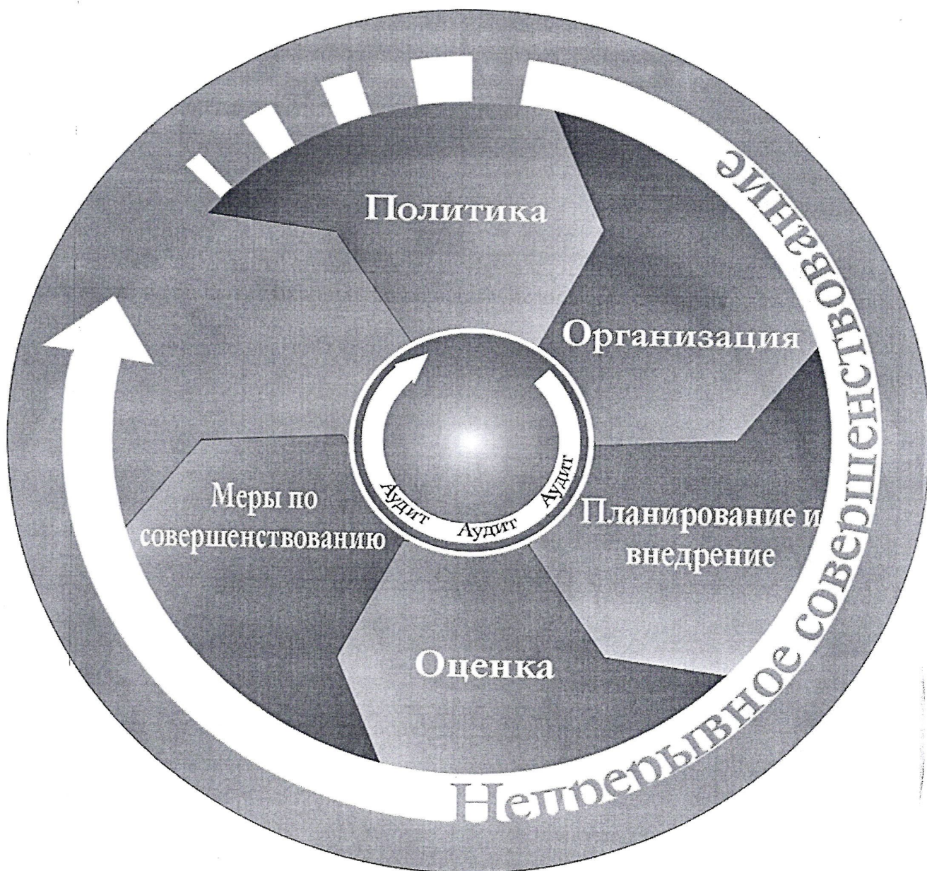
Рис. 1. Элементы СУОТ.